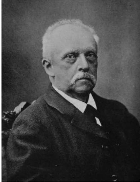
図 2 ヘルマン・フォン・ヘルムホルツ